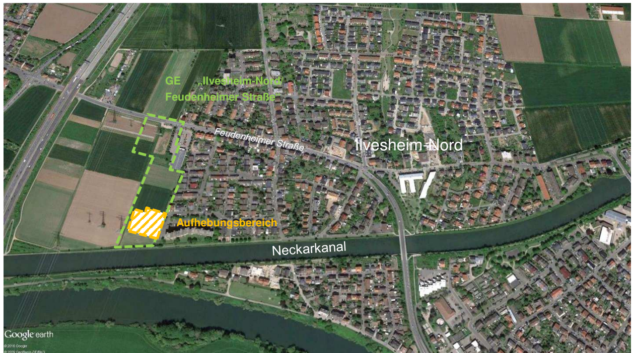
Abbildung 1: Lage im Raum