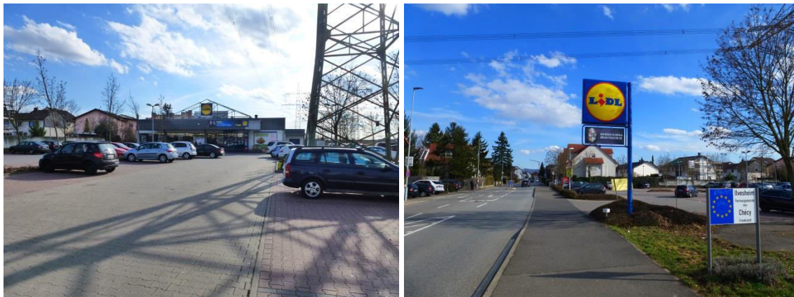
Abbildung 4: Ansicht Marktgebäude und vorgelagerte Stellplätze (li.), Zufahrt von Nordwesten