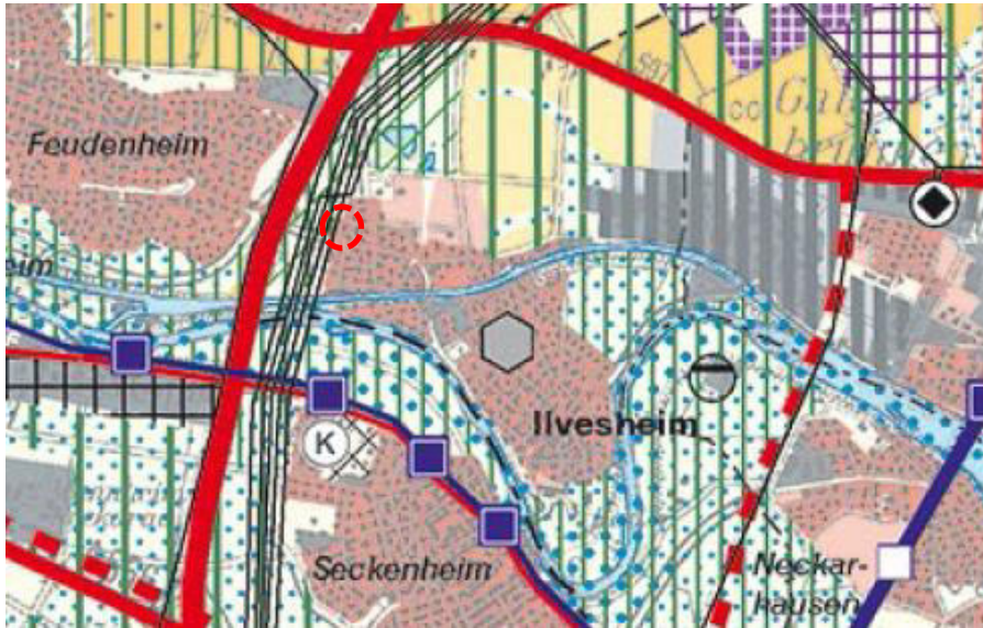
Abbildung 2: Auszug aus dem Regionalplan (Lage des Änderungsbereiches rot markiert, unmaßstäblich)

Die Stadt Mannheim bestätigt, dass die Erweiterung der Verkaufsflächen des Lidl-Marktes aufgrund der geringen Umsatzumverteilungen 3 zu keinen wesentlichen Beeinträchtigungen der schützenswerten Lagebereiche und der Nahversorgungssituation in Mannheim führen wird.