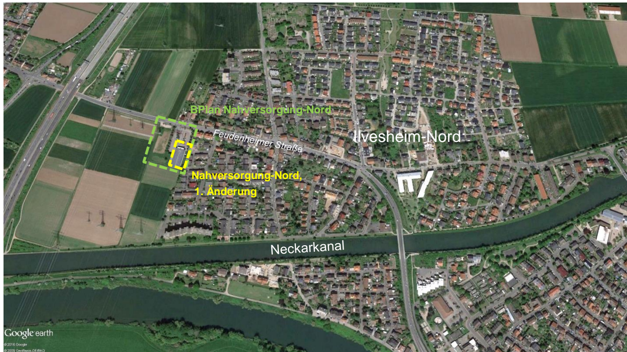
Abbildung 1: Lage im Raum

Das Plangebiet des Änderungsbebauungsplanes betrifft das Flurstück Nr. 2656 auf der Gemarkung der Gemeinde Ilvesheim.