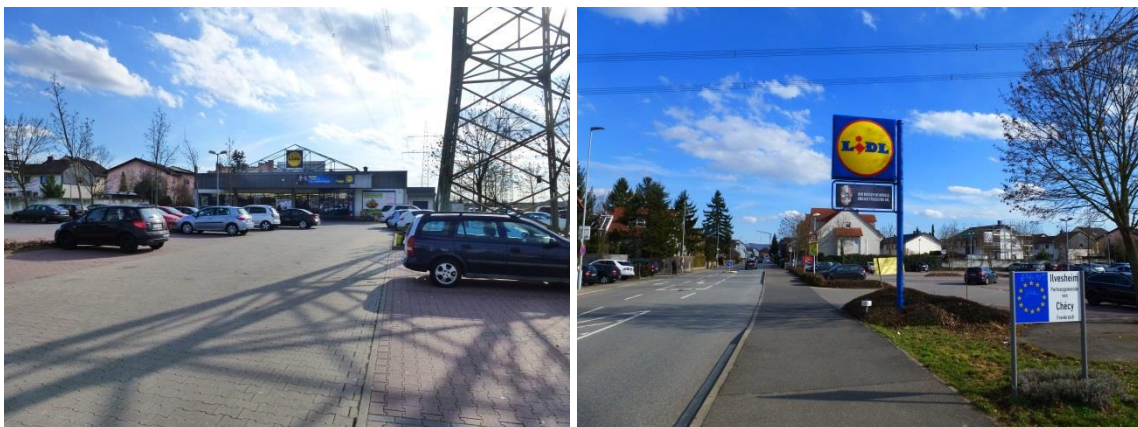
Abbildung 4: Ansicht Marktgebäude und vorgelagerte Stellplätze (li.), Zufahrt von Osten

Die Erweiterung der Nutz- und Verkaufsfläche des Marktes muss der städtebaulichen Situation unter Berücksichtigung der bereits im bestehenden Bebauungsplan festgesetzten Nutzungsbeschränkungen und Lärmschutzaufgaben Rechnung tragen.