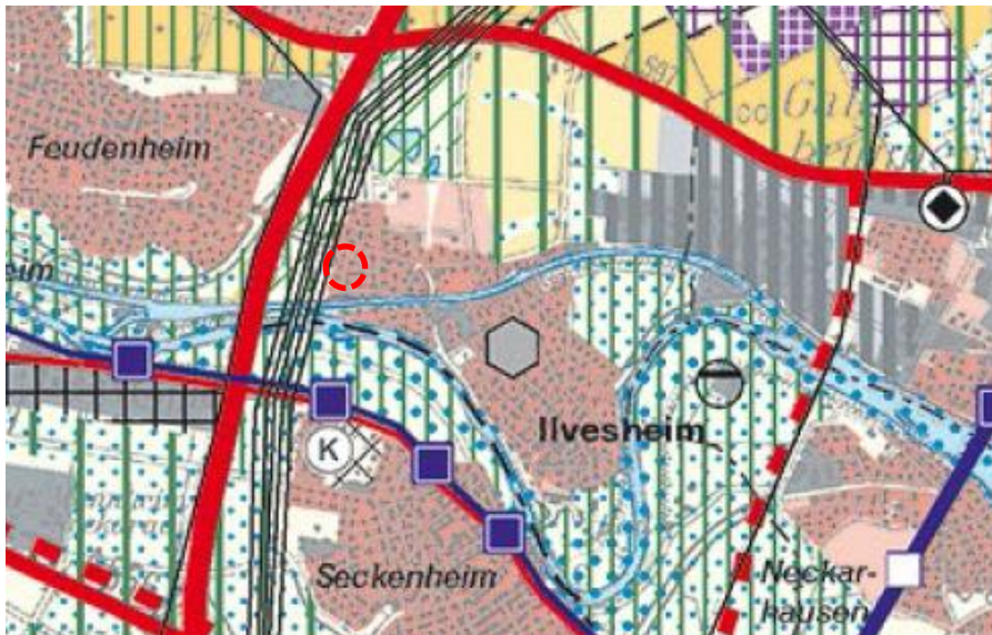
Abbildung 2: Auszug aus dem Regionalplan (Lage des Änderungsbereiches rot markiert, unmaßstäblich)